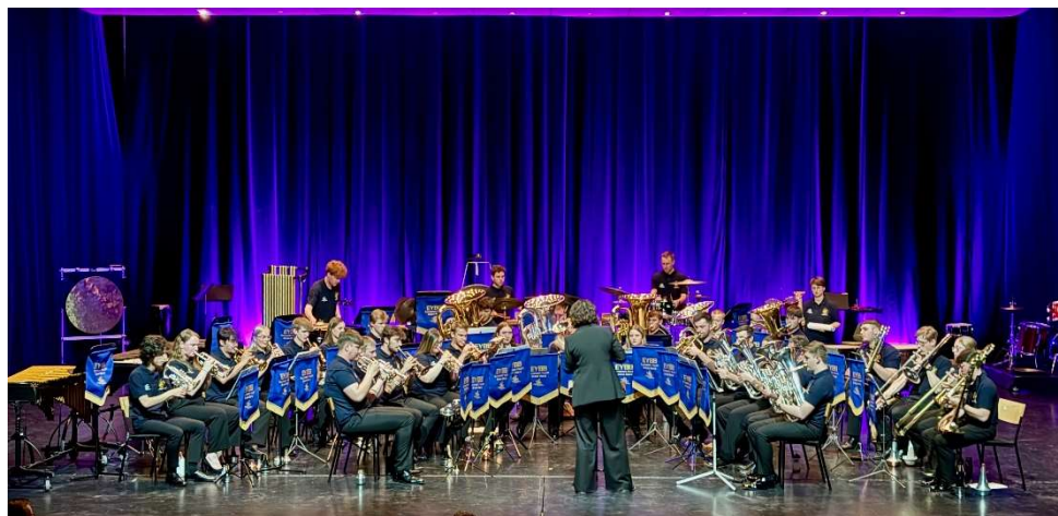
EYBB 2025 Stavanger